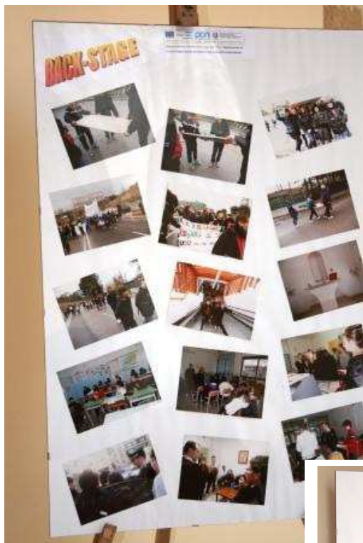
Back - stage