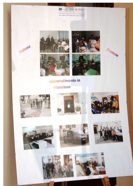
Apprendimento in situazione: visita alla caserma dei CC