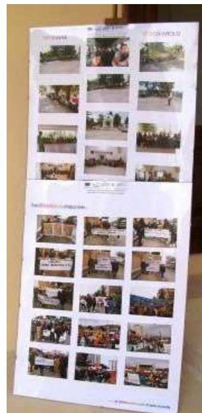
19/03/2011 Potenza :partecipazione alla giornata della memoria e dell'impegno