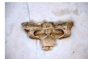
Particolari degli affreschi e