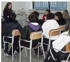
alunni di terza media

La Cooperativa summenzionata, con cui è stato sottoscritto un protocollo d'intesa, è associata a LIBERA, Associazione, nomi e numeri contro le Mafie , fondata da Don Luigi Ciotti il 25 marzo 1995, con l'intento di sollecitare la società civile nella lotta alle mafie e promuovere legalità e giustizia.