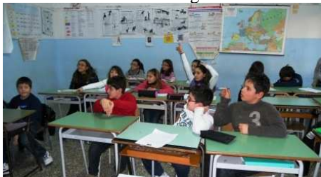
allievi delle V. della primaria

Il percorso sulla legalità ha visto protagonisti gli alunni delle classi quinte della Scuola Primaria e delle classi terze della Scuola Secondaria guidati, rispettivamente, dalle tutor interne prof.sse Luceri e Colucci. Partner istituzionale per l'attuazione del progetto è stata la Società "Cooperativa Sociale, Terre di Puglia-Libera Terra" che ha sede a Mesagne (Br), e si prefigge lo scopo di agganciare la tematica della legalità al vissuto dei giovani promuovendo il rispetto delle regole e incoraggiando la partecipazione e l'impegno civile, come concretamente avviene nel riutilizzo a fini sociali e produttivi dei beni e delle terre confiscate alla Sacra Corona Unita in Puglia, offrendo un esempio di gestione consapevole e sostenibile delle risorse agro-ambientali.