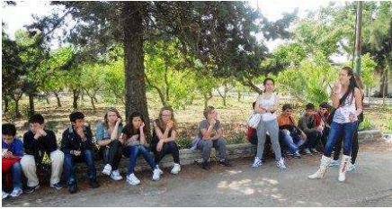
a Torchiarolo e Mesagne